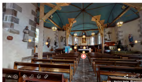
Vue de la visite 3D de l'église

La souscription lancée en 2018 avait un objectif initial de 124 000 €. Ce palier ayant été largement dépassé, un nouvel objectif a été fixé à 230 000 €. La souscription atteint déjà 66% de la somme visée, avec 170 000 € mobilisés.