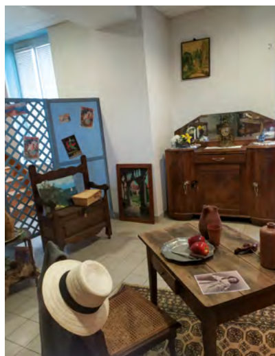
Illustration de la scène d'escape game

Un escape game et des locations de vélos à la longère du presbytère au Bourg