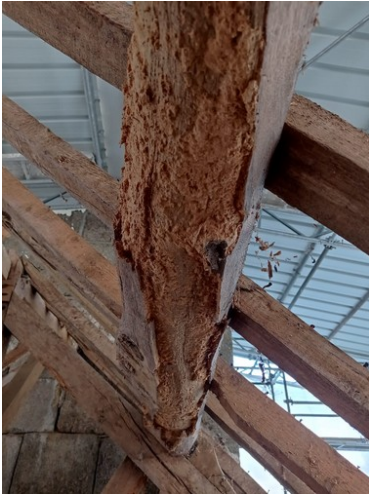
Détail d'une poutre

16 février : réunion de chantier : charpente et chevrons sont à nu