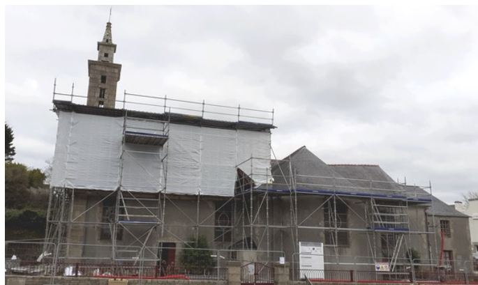
Vue de l'église et de son parapluie côté Sud