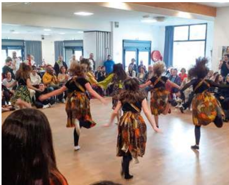
Suite du reportage photo en page 12

Le 10 décembre, une veillée bretonne clôturait ce marathon festif.