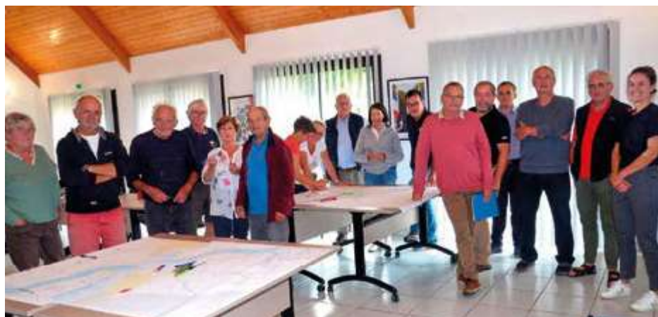
Les habitants, élus et agents planchent sur les cartes de la commune