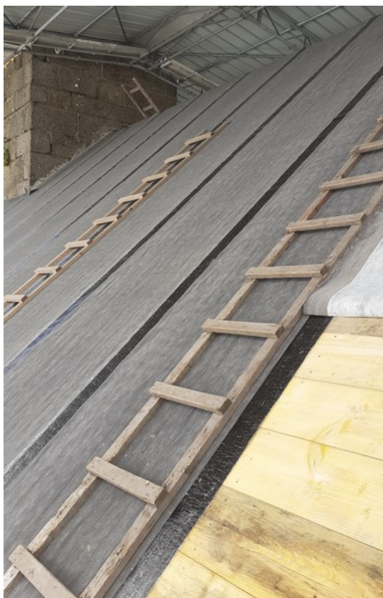
Vue de la volige et du feutre bitumé côté Sud du toit

11 mai : la volige et le feutre bitumé sont en place ; sur le côté Nord, début de pose des anciennes ardoises démontées et triées sur place ; un nettoyage ravivera les ardoises après la pose. Le versant Sud sera recouvert d'ardoises neuves.