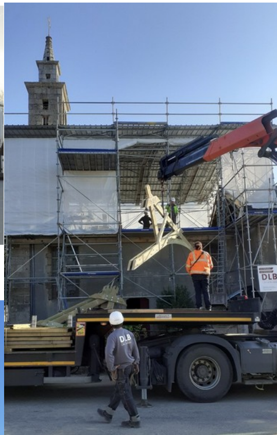
Une demi-ferme grutée directement sur le sol de l'échafaudage sous le parapluie