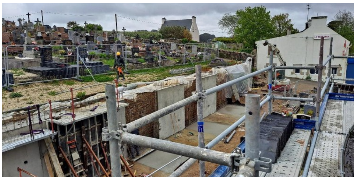
Photo Candio architecte : l'avancée du chantier mur vue de l'échafaudage de l'église

Le cimetière est désormais sauvé : tout risque d'effondrement du mur est écarté.