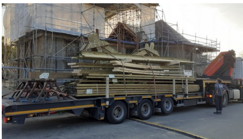
Le bois de charpente dans le camion à son arrivée au Bourg

20 avril : arrivée de la charpente au Bourg. Les fermes pré-assemblées aux Ateliers DLB et les chevrons ont été grutés directement sous le parapluie et sur l'échafaudage (photos ci-dessous).