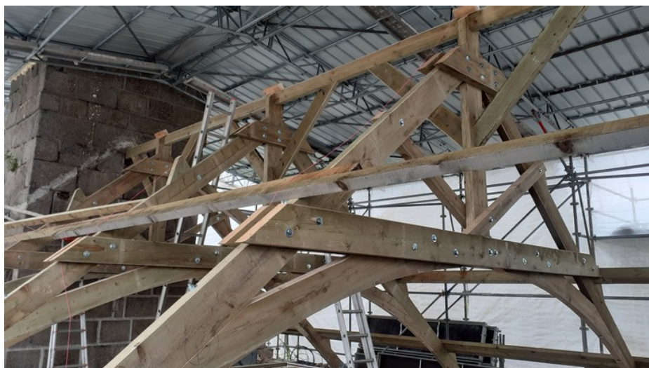
La charpente en cours de montage le 26 avril

La même semaine, les maçons de chez Lefèvre ont scellé les éléments de charpente et restauré les hauts de murs dans le pignon occidental de l'église (détail du mortier de chaux ci-dessous à droite).