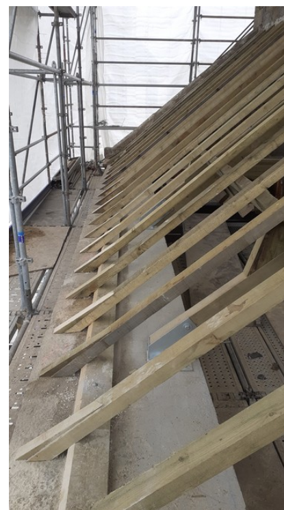
Détail des fermes de la charpente fixées à la poutre béton armé et des chevrons posés sur les pierres de corniches restaurées