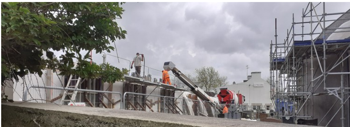
Le 24 avril, coulage du béton dans les banches ferrillées

Du côté du mur de soutènement : poursuite de l'empierrement du sol, ferrailage de la semelle et des contrevoiles, coulage du béton armé, début du ferrailage du parapet (photos ci-dessous).