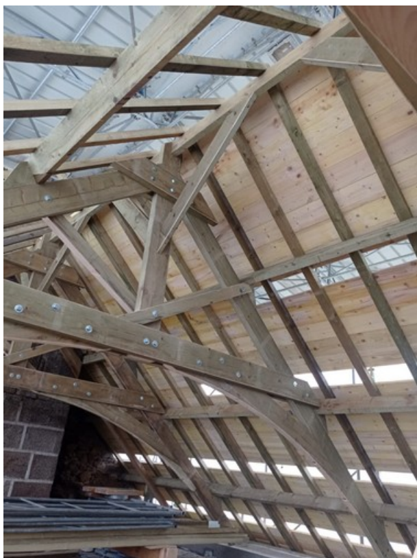
Pose de la volige côté Nord de l'église

4 mai : arrivée des couvreurs : début de pose de la volige (photos ci-dessous).