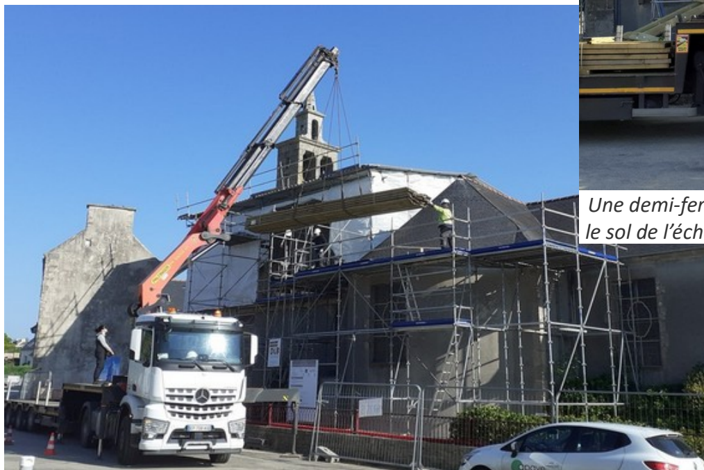
Le bois d'assemblage de la charpente gruté sur l'échafaudage