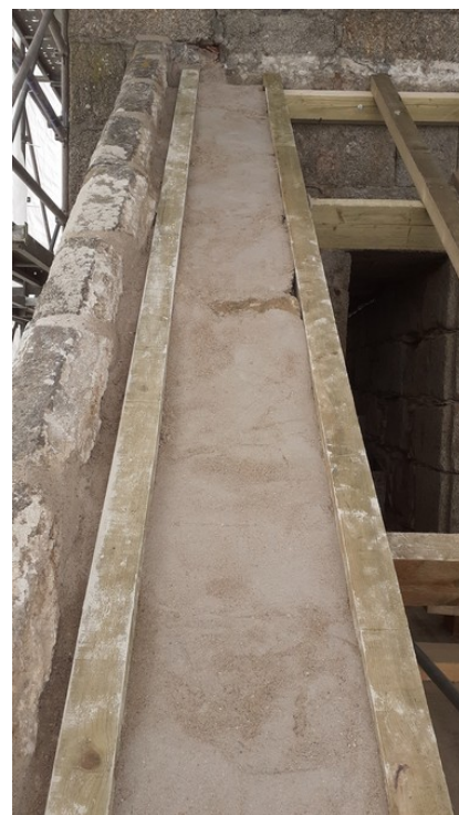
Détail de la restauration des pignons du clocher