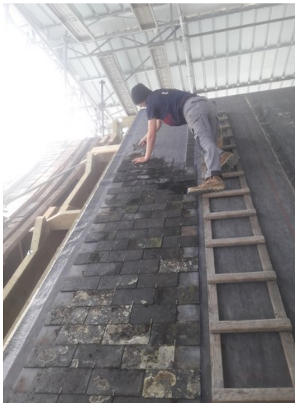
Début de pose des ardoises côté Nord. A noter la différence de niveau entre le faitage affaissé du transept à gauche et celui de la nouvelle charpente